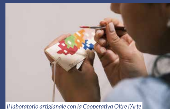
Il laboratorio artigianale con la Cooperativa Oltre l'Arte