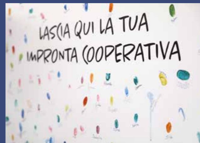
Le impronte lasciate dai Giovani Soci durante il Forum