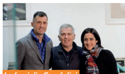
La famiglia Cerofolini