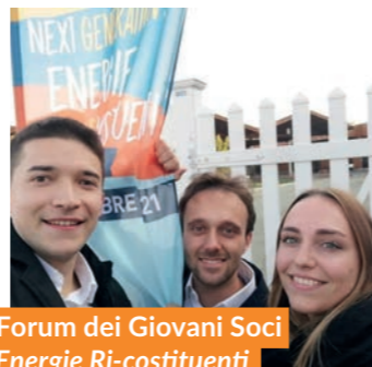
Forum dei Giovani Soci Energie Ri-costituenti