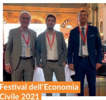
Festival dell'Economia Civile 2021

Il corso si è sviluppato in 4 appuntamenti online e 2 laboratori in presenza all'aperto su organizzazione di un set fotografico, realizzazione di posa e creazione di una sceneggiatura. Alcune delle foto realizzate sono state stampate e sono esposte in mostra, all'interno della programmazione espositiva di CasermArcheologica, suscitando molto interesse non solo tra i giovani, ma anche da parte del pubblico locale e da visitatori provenienti da tutta Italia.